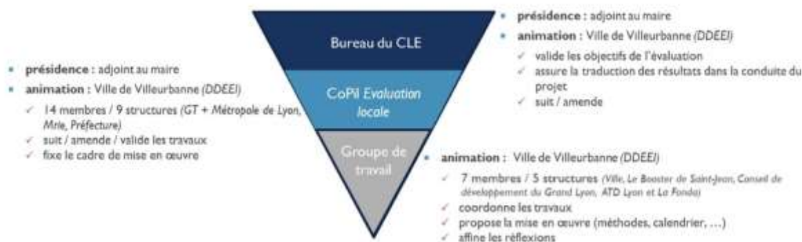
Figure 2 : Instances de pilotage de l'évaluation